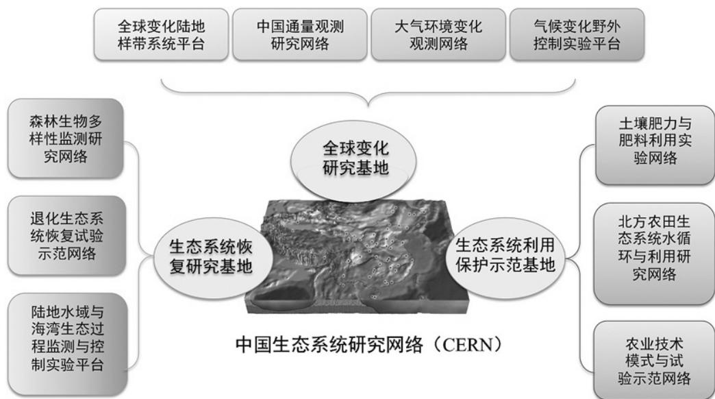
图2 基于CERN为核心的科学研究基地及专项观测实验研究平台